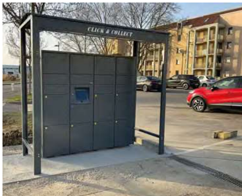
ABRI DE PROTECTION CONTRE LA PLUIE